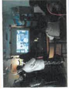
Atelier photo personnage