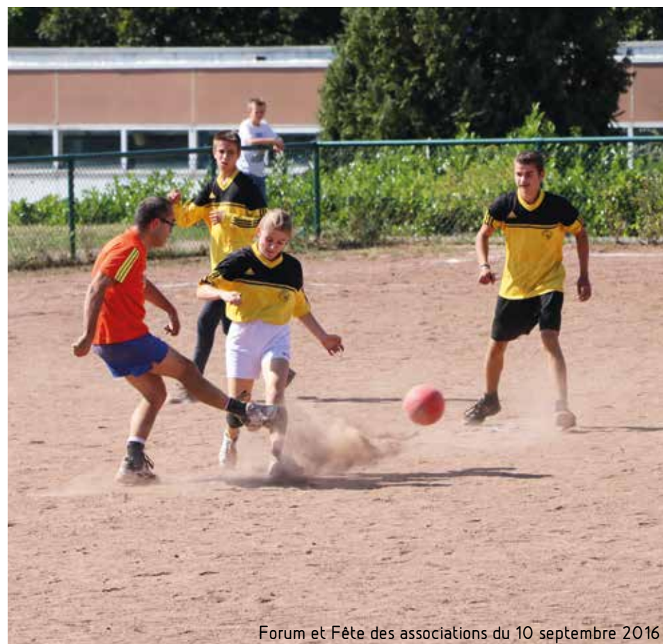
Forum et Fête des associations du 10 septembre 2016